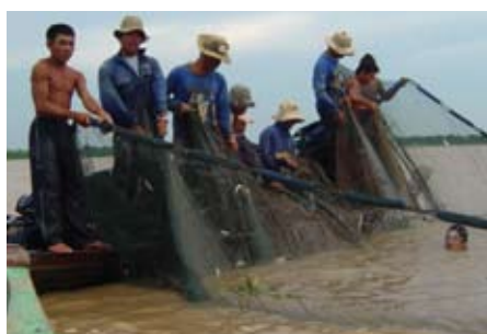
Pesca en arrozales con red de levantamiento manual en Tailandia. pescadores de tiburón en Senegal, bote artesanal de fibra de vidrio en Nicaragua pescadores con red de cerco, Tonle Sap, Camboya. Todos ellos son parte del sector pesquero a pequeña escala, el cual contribuye a la seguridad alimentaria y al alivio de pobreza