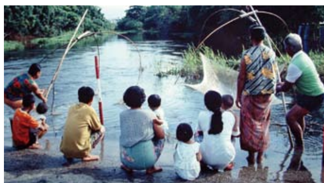
Es común la subestimación de las capturas y el empleo que está involucrado en la pesca a pequeña escala Imagen: pesca de río con red de levantamiento manual durante la estación de monzón, Tailandia

El Big Numbers Project (“Proyecto Gran Números”) es un esfuerzo en conjunto entre la FAO, Banco Mundial y el WorldFish Center, y se desempeña en colaboración con contrapartes nacionales. El Proyecto esta financiado por PROFISH, el programa global para la pesca sustentable del Banco Mundial. El Proyecto tiene como fin de fortalecer datos desagregados sobre la pesca de captura. Su intención es apoyar al establecimiento de procedimientos que permiten el análisis regular de estados y tendencias en las pesquerías, para contribuir a la formulación de políticas y consejos para su manejo a niveles nacionales y a nivel mundial. El primer objetivo del proyecto es el de obtener una radiografía de la situación actual, basado en las estadísticas y la información mas reciente posible. A través de la implementación de estudios de casos, en una selección de países en desarrollo, el proyecto recolectó información sobre pesquerías a pequeña y a gran escala en aguas continentales y marinas. A base de estos datos, e información de otros estudios recientes, el proyecto estimó