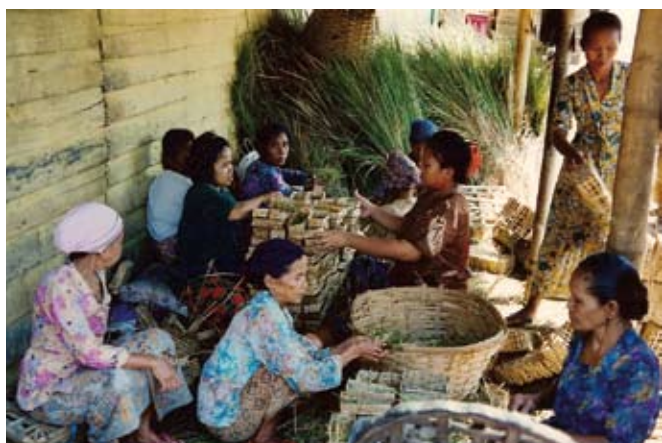
Mujeres en Pekalongan, Indonesia, preparan “ikan pindang” tradicional (pequeños pelágicos salados y hervidos a vapor en contenedores de bambú