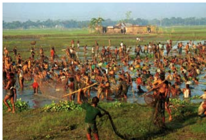
Trabajando en equipo, pescadores locales y aldeanos se involucran en la pesca de llanura, después de la época de inundación