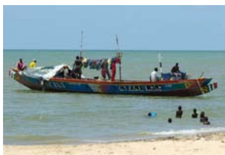
Pesca de pequeña escala puede ser parte de un conjunto complejo de estrategias de sustento, y puede ser desempeñado con herramientas manuales tal como la pesca de orilla. Los desembarques no se hacen en sitios de desembarque oficiales, ni entran las vías de distribución formales.