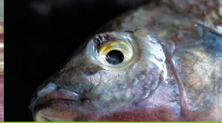
Eye endophthalmia/eye shrinkage

চোখ ফুলে যাওয়া/চোখ কোটর থেকে বেরিয়ে আসা