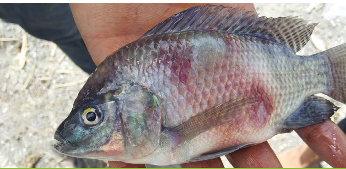
Skin erosions hemorrhagic lesion