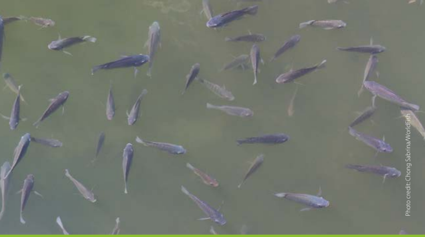
Fish lethargic at surface and not feeding

এই প্রচারপত্রটির উদ্দেশ্য হচ্ছে মৎস্য হ্যাচারি, নার্সারী, মৎস্য চাষী এবং সম্প্রসারণ কর্মীদের তেলাপিয়ার রোগ সনাক্ত এবং প্রতিবেদন তৈরিতে সক্ষমতা বৃদ্ধি করা। প্রাণীর রোগ ব্যবস্থাপনার জন্য সর্বোত্তম উপায় হচ্ছে রোগ প্রতিরোধ, প্রাথমিক পর্যায়ে চিহ্নিত করণ, রোগ নির্ণয় এবং সে অনুযায়ী দ্রুত ব্যবস্থা নেওয়া। তেলাপিয়া মাছের ড়োত্রোও প্রাথমিক পর্যায়ে রোগ সনাক্তকরণের বিকল্প নেই। নিচের চিত্রানুযায়ী যদি আপনি তেলাপিয়া মাছে রোগের লক্ষণ দেখতে পান, অস্বাভাবিক আচরণ এবং অস্বাভাবিক মৃত্যু লক্ষ্য করেন, তাহলে আপনার নিকটস্থ স্থানীয় মৎস্য স্বাস্থ্য বিশেষজ্ঞ এবং পরামর্শদাতার সাথে অবিলম্বে যোগাযোগ করুন।