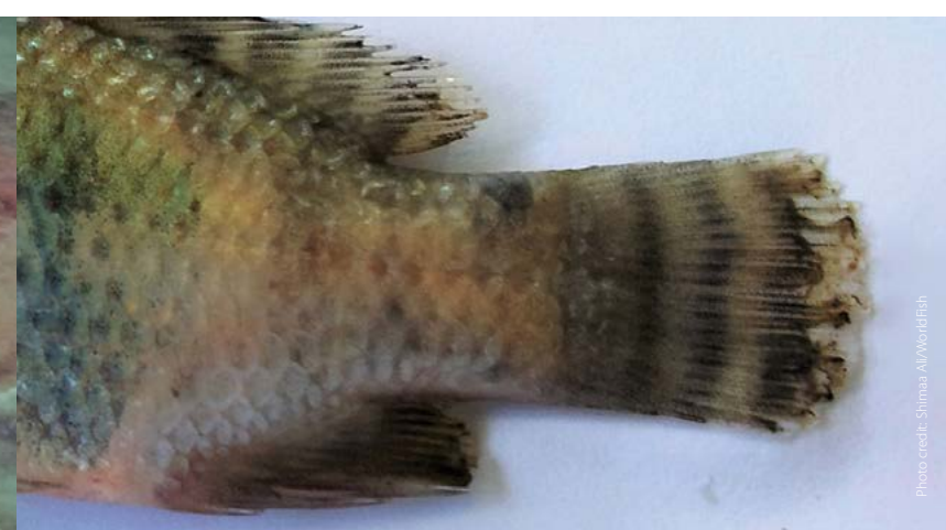
Fin rot/tail rot