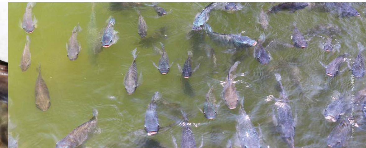
Fish gasping air at the surface

মাছ উপরিভাগে মুমূর্ষু অবস্থায় বাতাস নেয়/খাবি খাওয়া